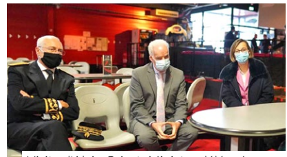
Visite d'Alain Griset, Ministre délégué des Petites et Moyennes Entreprises, au Bowling Red Bowl à Ste-Gemmes-Sur-Loire

Je me suis entretenue avec des entreprises locales et avec Alain Griset , Ministre des Petites et Moyennes Entreprises, qui est venu à Angers en février pour mieux comprendre les difficultés de ce secteur . Il s'est rendu à la salle de jeux pour enfants Ouistiti à Beaucauzé et a participé à une table ronde avec les acteurs économiques du département à la CCI. Un dispositif de soutien a ainsi pu être mis en place pour prendre en charge les coûts fixes des entreprises les plus touchées par la crise. Les discothèques ont également été intégrées à ce dispositif.