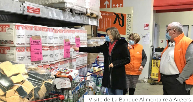
Visite de La Banque Alimentaire à Angers