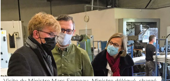
Visite du Ministre Marc Fesneau, Ministre délégué, chargé des Relations avec le Parlement et de la citoyenneté, chez Delta Usinage à Mûrs-Erigné