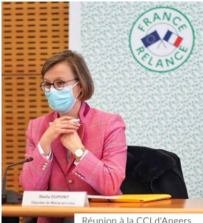
Réunion à la CCI d'Angers