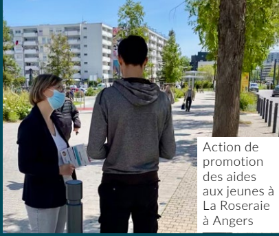
Action de promotion des aides aux jeunes à La Roseraie à Angers