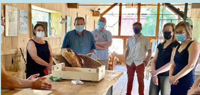
À La Cabane à Pains à Saint-Aubin-de-Luigné, commune de Val-du-Layon, le 11 juin 2021

Comme chaque année, j'ai organisé des « zooms locaux » afin d'aller à la rencontre des acteurs économiques, associatifs, des citoyens et des élus de ma circonscription. Ces journées sont l'occasion pour moi de nourrir mon travail législatif , de répondre aux demandes locales ou individuelles , de connaître les initiatives, projets ou innovations du territoire.