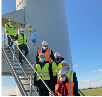
Visite du parc éolien de Chanzeaux à Chemillé-en-Anjou, avec Barbara Pompili, Ministre de la Transition Ecologique

Des épisodes climatiques ont eu des effets dévastateurs sur les cultures. Les viticulteurs ont, par exemple, été particulièrement touchés par le gel du printemps . Au sein du Groupe d'études Vigne, Vin et Œnologie , nous avons œuvré pour un soutien effectif de l'Etat . Le fonds d'urgence permet aux Préfets d'attribuer des aides de trésorerie. La mise en place d'une « année blanche » pour les cotisations sociales des exploitations constitue également une mesure forte d'aide aux secteurs touchés. Par ailleurs, nous avons souhaité réviser la loi pour renforcer les outils pour assurer une juste rémunération des agriculteurs. Le texte a été voté à l'unanimité à l'Assemblée et est actuellement au Sénat. Je souhaite qu'il soit examiné rapidement pour entrer en vigueur au plus vite.