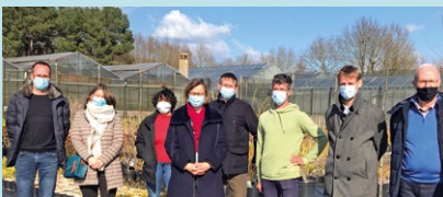
À La Joyeuse Pépinière de Sarrigné, le 19 mars 2021