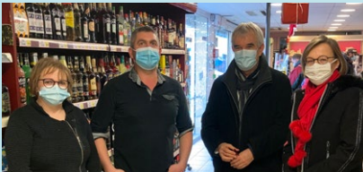
À la supérette G20 de Ste-Gemmes-sur-Loire, le 15 janvier 2021