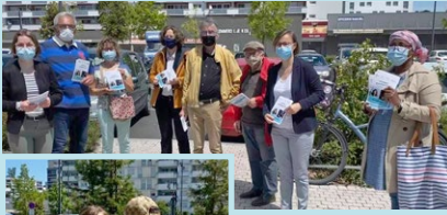
Action de promotion des aides aux jeunes à La Roseraie à Angers, le 28 mai 2021