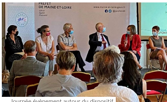
Journée événement autour du dispositif 1 Jeune 1 Solution le 2 juillet 2021