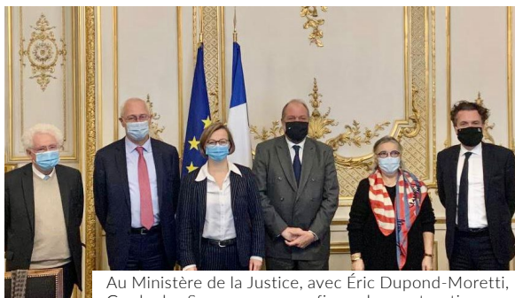
Au Ministère de la Justice, avec Éric Dupond-Moretti, Garde des Sceaux, pour confirmer la construction de la Maison d'Arrêt de Trélazé