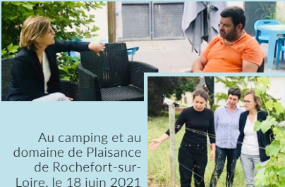
Au camping et au domaine de Plaisance de Rochefort-sur-Loire, le 18 juin 2021