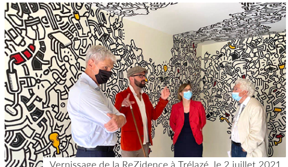
Vernissage de la ReZidence à Trélazé, le 2 juillet 2021

On parle souvent des aides au monde culturel, je crois qu'il faut surtout parler de tout ce que la culture et les artistes nous apportent dans leur sensibilité et leur capacité à nous faire partager, à révéler, à exprimer les bonheurs mais aussi les tourments qui nous traversent pour nous permettre de mieux les dépasser. On a donc particulièrement besoin du monde culturel et des artistes aujourd'hui ! Merci à eux, à l'image du collectif de la ReZidence de Trélazé.