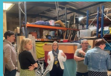
Les Ponts-de-Cé - visite du PAVÉ (lieu d'accueil de nombreuses compagnies et artistes) 6/06/25