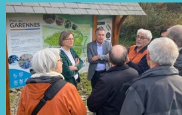
Visite du Parc des Garennes à Juigné-sur-Loire, commune délégée des Garennes-sur-Loire 6/03/26