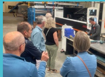
Ste Melaine sur Aubance - visite de Formatex 19/09/25