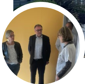
Visite de l'UPAO (Unité Psychiatrique d'Accueil et d'Orientation) du CESAME le 9 septembre 2025