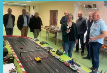
Sarrigné - rencontre avec des bénévoles du Slot Racing 4/04/25