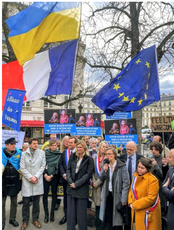
Manifestation en soutien à l'Ukraine en mars 2025

Une Europe présente, respectueuse des nations, solidaire face aux crises et capable d'autonomie face aux grandes puissances est possible. C'est une nécessité pour notre sécurité et pour la défense de nos valeurs.