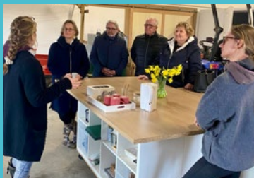
Denée - visite de la ferme horticole Les Ligériennes 23/01/26