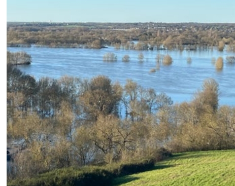
Île de Rochefort-sur-Loire, vue de La Haie Longue

Crue de la Loire : Chalennes-sur-Loire le 16/02/2026