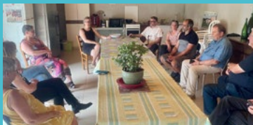
St Aubin de Luigné (Val-du-Layon) échanges avec un agriculteur 13/06/25