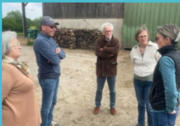
Rochefort-sur-Loire - rencontre avec un agriculteur bio 25/04/25