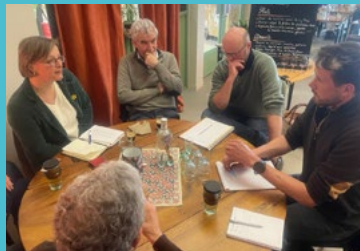
Ste Gemmes sur Loire - rencontre avec l'association du Pôle végétal Loire Maine 21/03/25

Et les zooms locaux continuent en 2026 dans chaque commune de la circonscription !