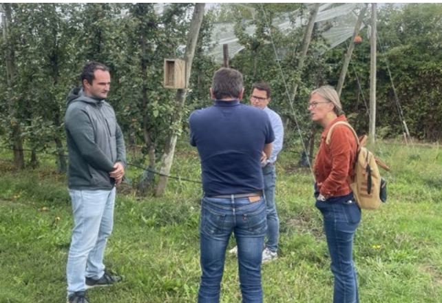
Visite du verger de la Blottière à Chemillé-en-Anjou le 10 septembre 2025

Soutenir notre agriculture, c'est garantir notre indépendance, préserver nos territoires ruraux et assurer une alimentation de qualité pour tous.